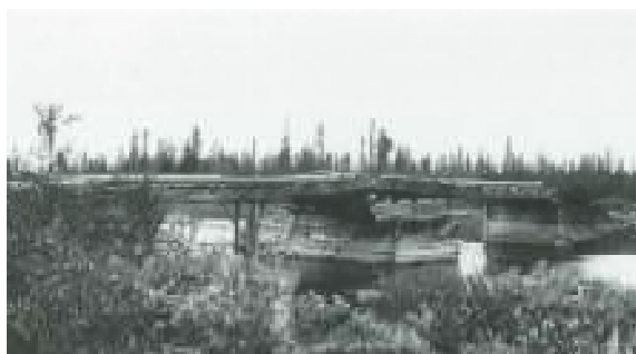
Lofsbron efter Häggingåsvägen 1920 (Boken: Glöte genom 600 år)

Lofssjön är ca 1,7 mil lång, ca 2 km på det bredaste stället och ca 60 meter där den är som djupast. Omkring 10 större åar och bäckar förser Lofssjön med vatten t ex Stråån, Sömlingsån, Häggingån, och Djursvasslan. Regleringen innebar att Lofssjön höjdes med ca 7 meter.